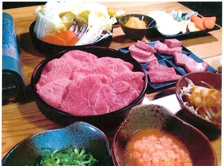
写真は、別コースのメニューです